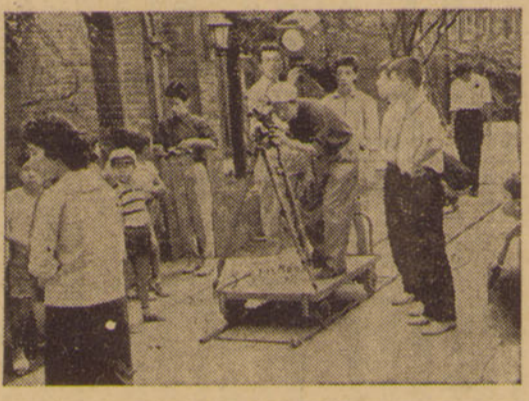
この写真は、級委で講演会を開催する様子を示している。

映画研究会 奔走近く試写会を開催し、映画研究会が主催する試写会が、学生生活センターで開催された。