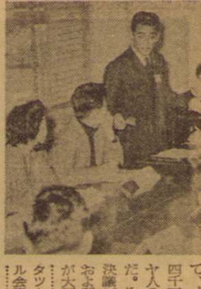
国際学生交流会の様子

この激動した一九五六年から、我々は大きな変化を経験した。戦後十一年、我々は自由と民主主義の国として歩みを進めてきた。しかし、この一年は、我々の歴史の中で最も重要な一年であった。我々は、戦後の理想を追求し、社会の発展に貢献しようとした。しかし、現実には、我々の理想と理想との間に大きなギャップがあった。我々は、このギャップを埋め、理想と理想との間に橋を架けようとした。我々は、この橋を架け、理想と理想との間に橋を架けようとした。我々は、この橋を架け、理想と理想との間に橋を架けようとした。