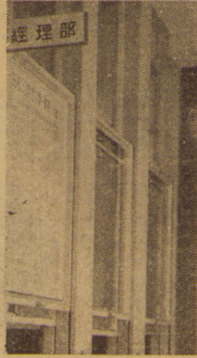
(写真は本学経理部窓口)