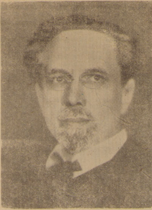
ウエルネル・ゾムバルト