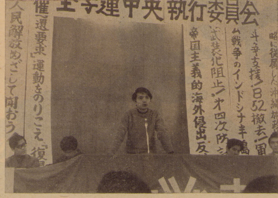
全学連第53回中央委員会開催す 3月28、29日