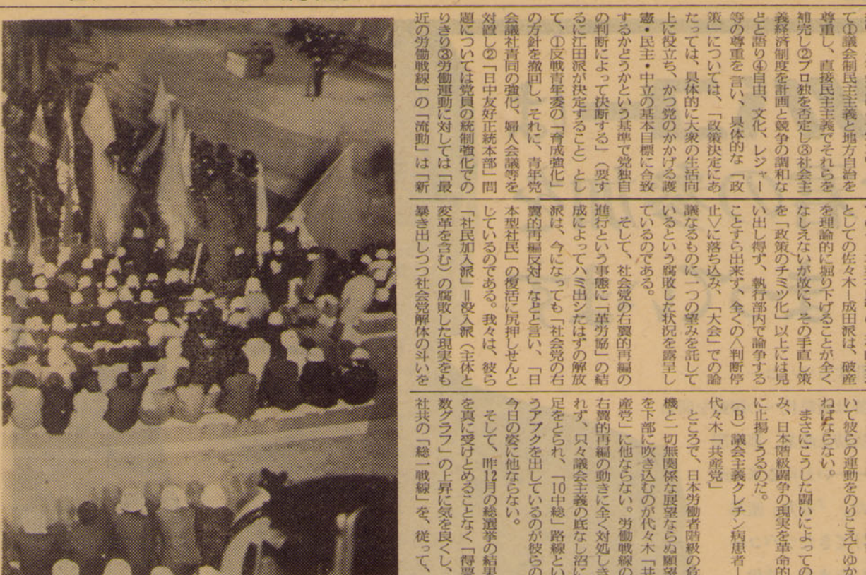
立教大学学生運動のゲリラ戦を! (写真)