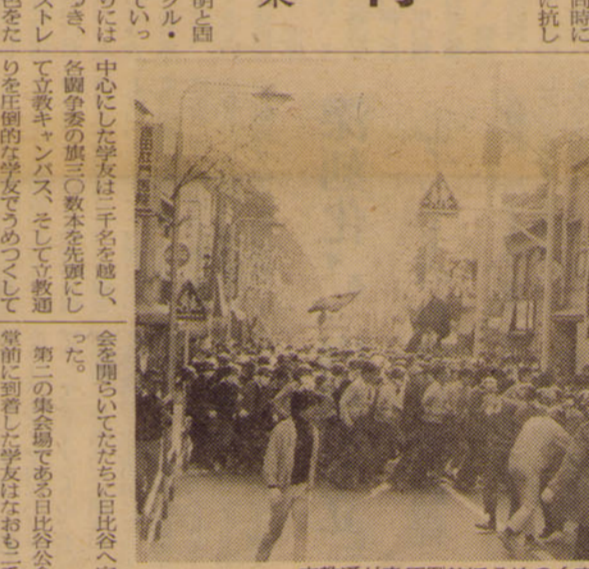
立教通りを荘厳に閉めつづける二千数百の学友

六月二十日、立教大学大講堂において、二千数百名の学生が参加した抗議行動が行われた。この抗議行動は、民青系執行部のリコールを要求するものであった。