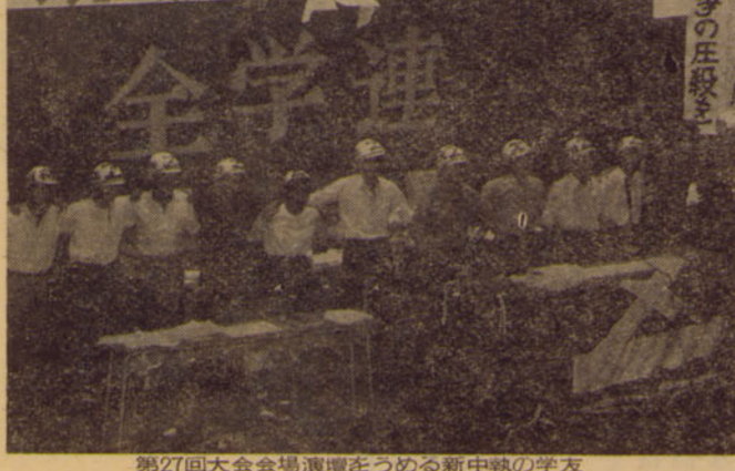
第27回全国大会会場演壇を志める新中戦の学友

七月三日、早稲田大学大講堂において、第27回全学連定期大会が開かれた。この大会には、全国から四千名以上の学生が参加した。大会は、全学連の活動報告、今後の活動方針の決定などを行った。