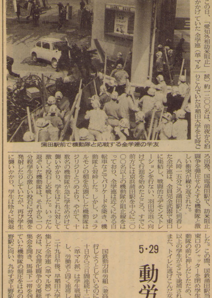
蒲田駅前を機動隊と対峙する全学連の学友