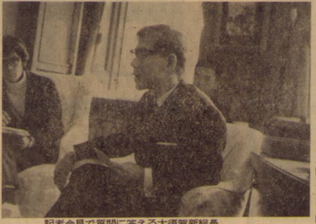
記者会見で質問に答える大須賀新総長 (5月11日総長室で)