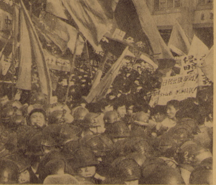
新時代の科学・技術書