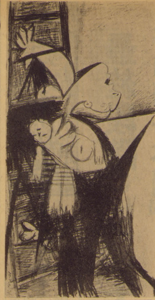
はしごの上の母親と死んだ児 壁面製作前の数多くの試作の1

ピカソの作品は、戦争の悲惨さを表現している。彼の絵画は、人々の心を揺さぶっている。