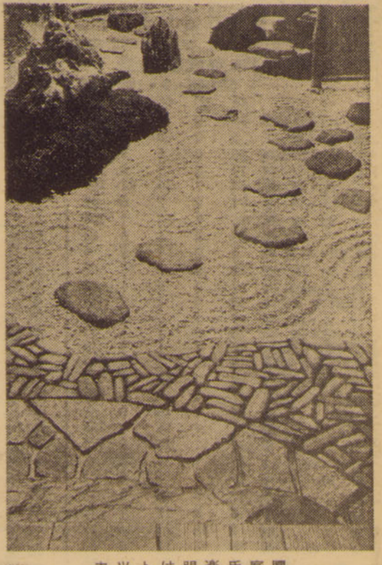
カッツは明美氏庭園