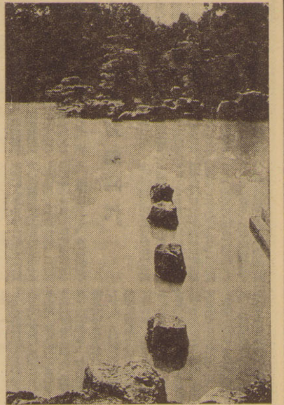
教養文庫「日本の庭園」より