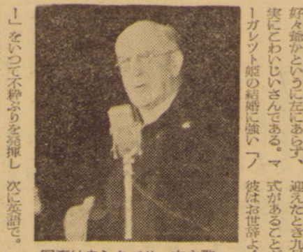
写真はカントベリー大主教

カントベリー大主教の印象。カントベリー大主教の印象。カントベリー大主教の印象。カントベリー大主教の印象。カントベリー大主教の印象。