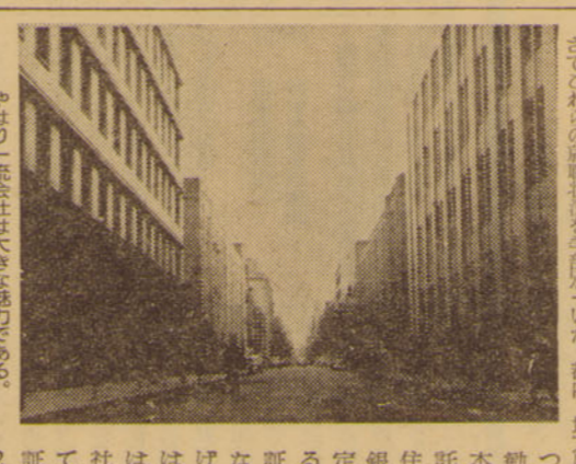
これは、立教大学新校舎の一部である。

昨年度就職状況から、就職戦線は始まった。昨年度就職状況から、就職戦線は始まった。昨年度就職状況から、就職戦線は始まった。