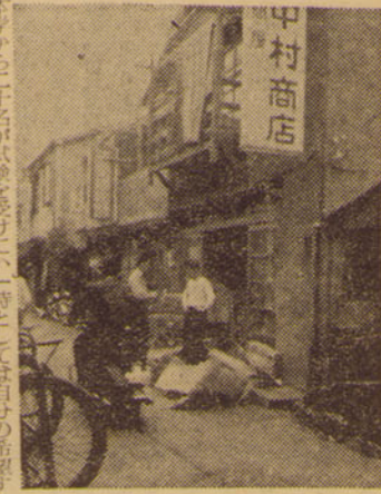
中小企業でも自己に達つていればよいわけだが……

中小企業でも自己に達つていればよいわけだが……。中小企業でも自己に達つていればよいわけだが……。