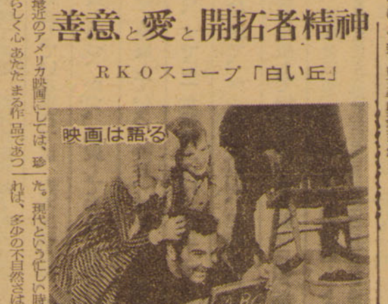
善意と愛と開拓者精神 RKOスコープ「白い丘」

善意と愛と開拓者精神は、人間の心を豊かにする。それは、人生の道を照らす光である。それは、人生の迷途を導き、人生の希望を燃やす。善意と愛と開拓者精神は、人生の意義を創造し、人生の価値を高める。善意と愛と開拓者精神は、人生の道徳を築き、人生の美しさを増す。善意と愛と開拓者精神は、人生の希望を創り、人生の未来を明るくする。善意と愛と開拓者精神は、人生の道徳を築き、人生の美しさを増す。