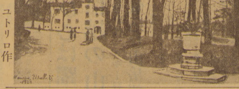
農業学校 ユトリロ作