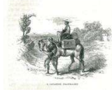
日本人の旅行の一例