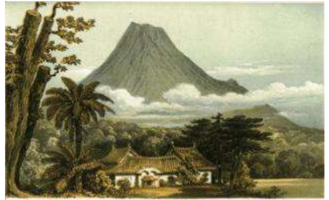
吉原から見た富士山