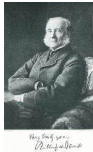
オールコックの肖像（『富士登山と熱海の硫黄温泉訪問』 2010 より）