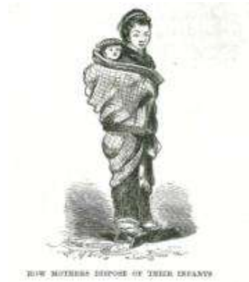
幼児を背負う母親