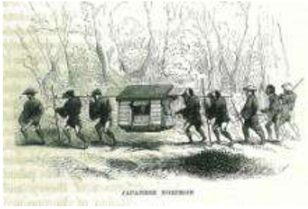
日本の乗物（ノリモン）