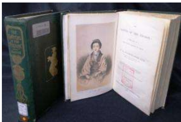
『The Capital of the Tycoon: a narrative of a three years' residence in Japan』 London 版