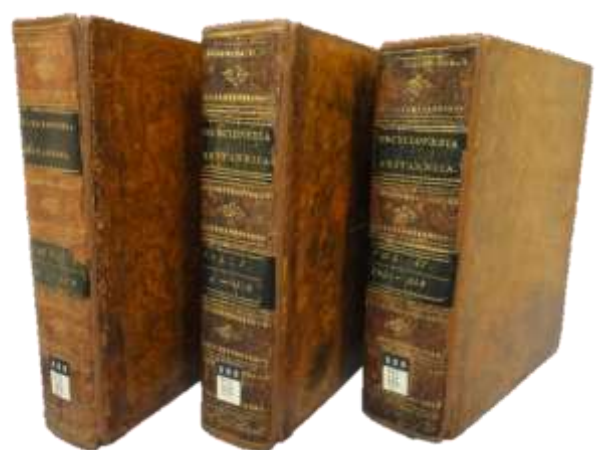
<ブリタニカ百科事典第3版>