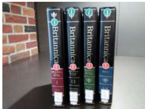
池袋図書館の The New encyclopædia Britannica 15 版から（所在:1F 西 参考図書）。1 巻(マクロペディア・赤),13 巻(マクロペディア・黒),プロペディア(緑),インデックス(青)と背表紙の色が異なる

この小文を依頼されて『ブリタニカ百科事典』を改めて読んだ。この百科事典は現代世界で最も完全な、信頼できる内容を持つ百科事典であると言われる。だが読んでみて思ったのは、正直に言えば、「百科事典って何だろう？」ということである。第15版（2010年）はマイクロペディア12巻、マクロペディア17巻、プロペディア（手引き）1巻、索引2巻の合計32巻からなる。膨大な事典である。分量に圧倒されながらも、自分が関心を持っているいくつかの項目を調べてみた。そして「この事典は実際に役に立つのだろうか？」と思った。マイクロペディアは「簡潔な」百科事典である。項目は無記名である。だが明快で客観的な解説は小気味よく、レファレンスとして秀逸である。（項目によっては情報・データが古いものもあるが）対照的に、マクロペディアは「詳細な」百科事典である。すべて専門家が執筆し、多くの場合名前が記されている。だがこれはいったい何なのだろうか。網羅的な、興味深い記述ではあるが、かと言ってエッセーでも研究論文でもない。また項目の選別には編者の嗜好が、また記述には筆者の意見が強く反映しているようであった。